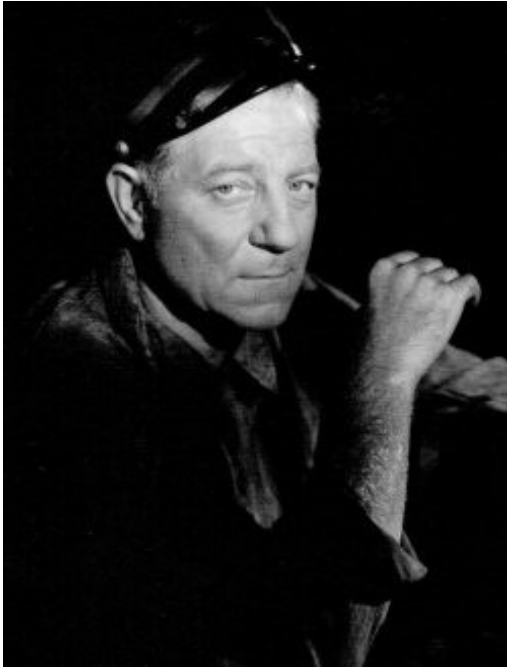
Jean Gabin, 1949.