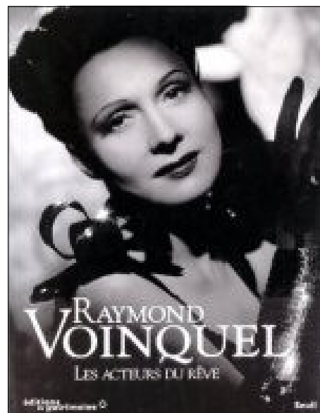
Couverture du livre de l'exposition. Raymond Voinquel Les acteurs du rêve, éditions du patrimoine, Seuil.

Du 26 septembre 1997 au 4 janvier 1998 a lieu à l'hôtel de Sully, Paris IV ème , une exposition de la Direction du Patrimoine, Mission du patrimoine photographique, Ministère de la Culture et de la Communication : Raymond Voinquel - Les acteurs du rêve. À l'occasion de la présentation de l'exposition, les éditions du Patrimoine et les éditions du Seuil publient : Raymond Voinquel - Les Acteurs du rêve.