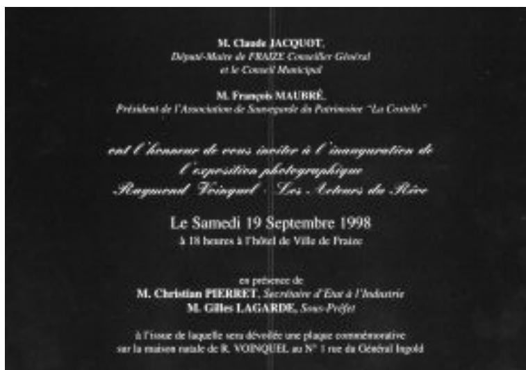
Invitation à l'exposition à la mairie de Fraize