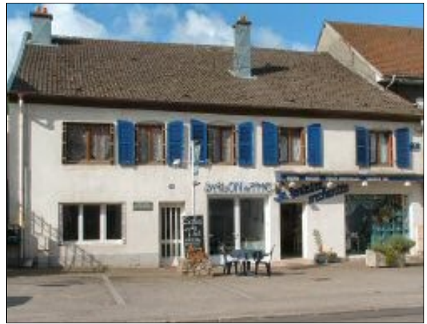
La même maison, de nos jours, sur laquelle on distingue la plaque entre fenêtre et porte gauche.