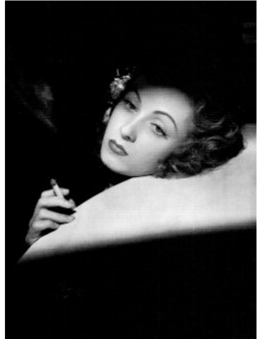
Daniele Darrieux, 1939.