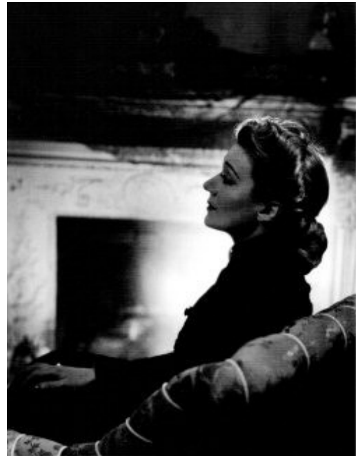
Edwige Feuillère, 1947.