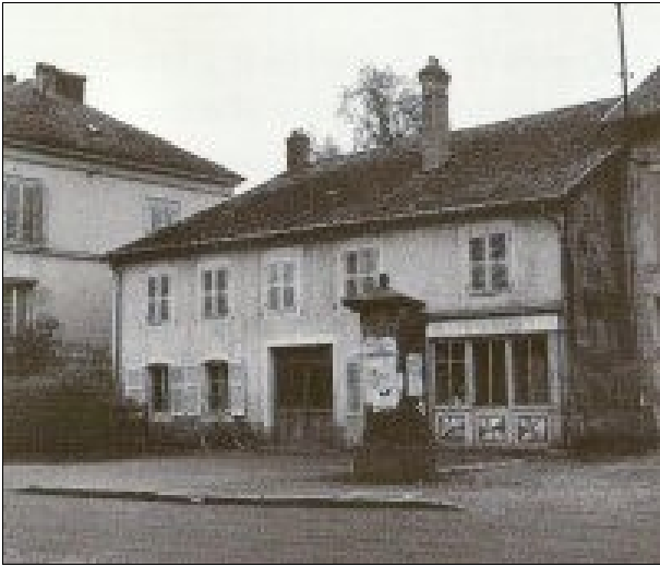
Maison natale de Raymond Voinquel, place Demenemeix à Fraize