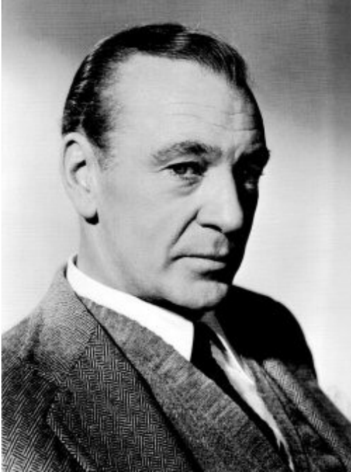
Gary Cooper, 1957.