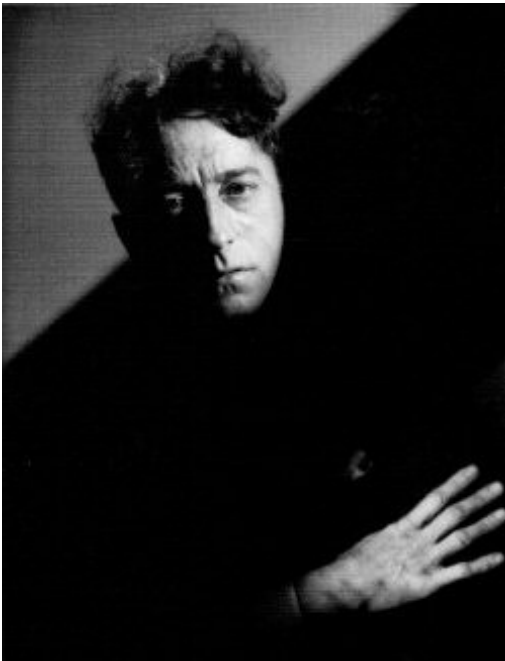
Jean Cocteau, 1942.