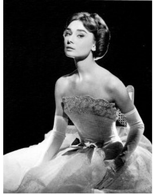
Audrey Hepburn, 1956.